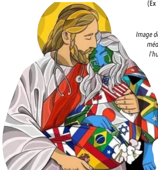
Image de Jésus, médecin de l'humanité